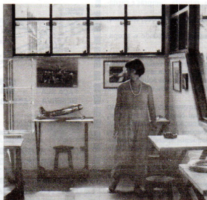
Sala de Engenharia Junior

Dependem para tudo de terceiros. A desmistificação da tecnologia faz com que a criança passe a mexer, abrir, desmontar. Ela pode aprender a consertar o motor de um carro, transformar um liquidificador quebrado num robô e porque não, fazer uma instalação elétrica em casa.