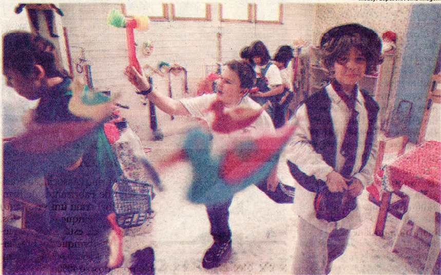
Crianças brincam na Brinquedoteca Indianópolis, que recebe grupos de crianças